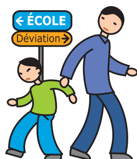
N'apprécie pas les changements