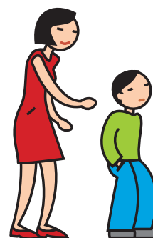
Manifeste de l'indifférence