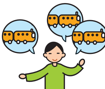
Parle de façon incessante sur un sujet particulier