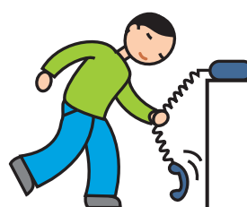
Utilise les objets de façon atypique