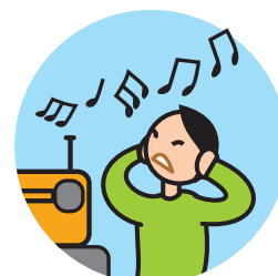
Peut être hypersensible aux sons, aux odeurs ...