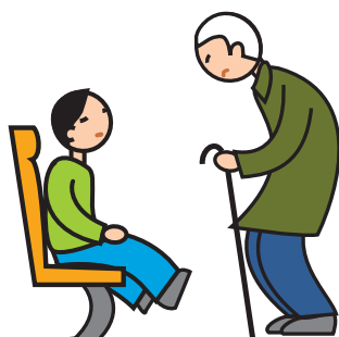
Comprend mal les conventions et les règles sociales