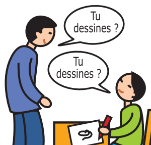
Utilise le langage de façon écholalique