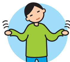
Présente des comportements bizarres