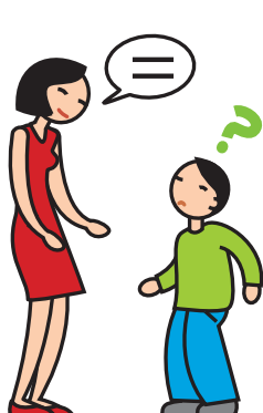
A du mal à comprendre et à se faire comprendre