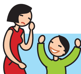
Rit de façon inappropriée