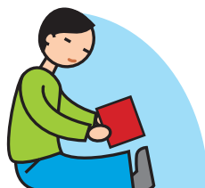
Manque de jeux imaginatifs