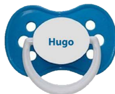
chez Valérie Dewilde