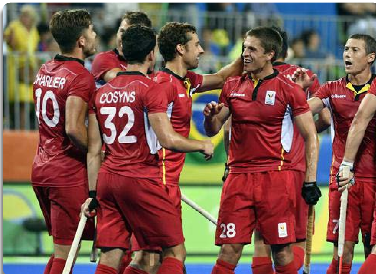
Les Red Lions après leur victoire lors de leur deuxième match de poule contre le Brésil