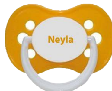
chez Badr Laaouar