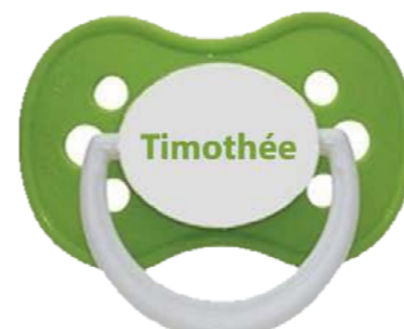
chez Céline Mollaert